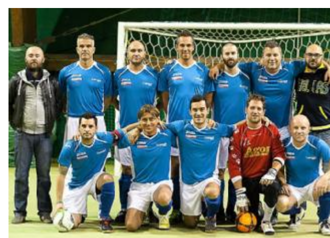
La formazione della Clessidra.Com

In A2 nel girone A la capolista Clexidra.com vince 7-1 sul Valpolicellas: ai play-out andranno Sydney Pizzeria Marni, Aran Irish Pub e Elio Porte Blindate, vincitori su Kubitek, Sanitaria San Massimo e Ospedaletto. Nel B nessun problema per la BNC Splash con la Coven United: già definite le altre posizioni, il secondo posto dell'Aggriturismo Cà Del Pea, sconfitto dai Polemici, mentre la Lanterna Bardolino