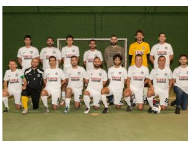
I Red Devils, militano nel girone A di serie A1

Gli Arditi, nella seconda sfida del girone, invece, si sono imposti 5-3 sull'Heart Of Verona. Tutto rimandato quindi al prossimo turno. Nel quarto e ultimo raggruppamento del trofeo Ostilio Mobili si sono affrontati i campioni del Corvinal Hunedoara e i vincitori del secondo girone di A2, la Kubitek. Ad