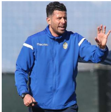
Fabio Grosso, la A passa attraverso i play off FOTOFESPRESSO